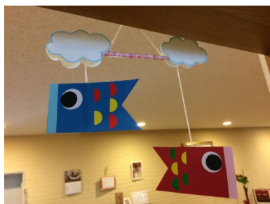
*お母さん方に人気だったこいのぼり

さて、次回も季節の物を制作したいと考えています。予約は必要ありませんので、当日お気軽にご参加ください。