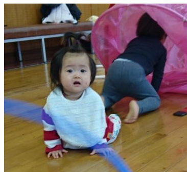
はいはいで探検中