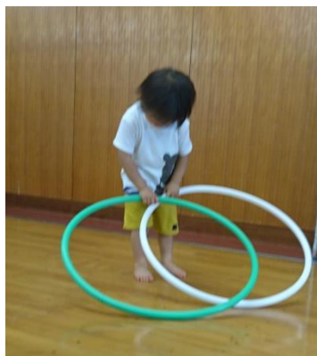
フープを自分なりに持って、いろいろ動かしてみます

回数を重ねるごとに高低差をつけるなど子どもたちの成長に合わせて変化させ、静の活動ばかりではなく、動の活動も織り交ぜながら子どもたちの育ちにつなげていければと思います。(村上)