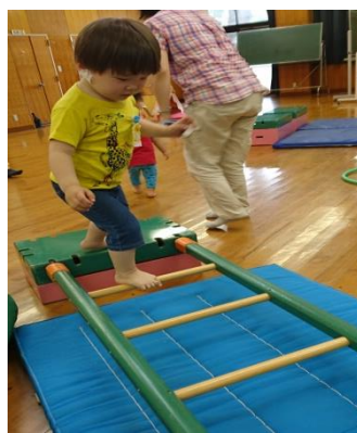
間隔の空いたはしごを1つ1つゆくり渡ります