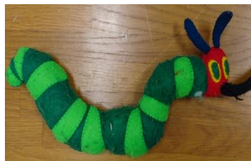
たいむにある玩具