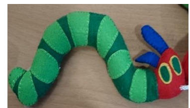
リクエストにて作り直した玩具